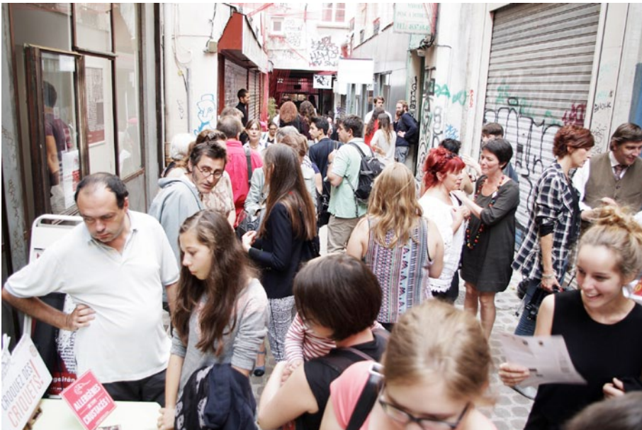
Édition 2014 du Festival Passage Pas Sage, passage des Gravilliers, à Paris.